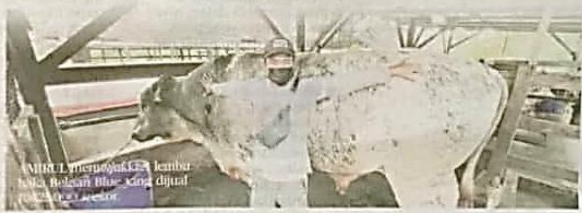
AMIRUL menyayak 70 lembu baka Belgian Blue yang dijual untuk ibadah korban.

"Kami tidak kisah menjalankan ibadah korban itu walaupun perlu mengikuti SOP yang lebih ketat asalkan ibadah korban itu boleh dijalankan," katanya.