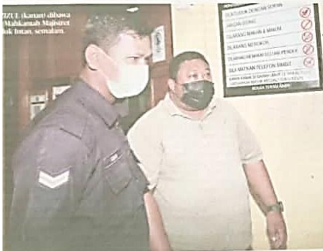
ZUL (kanan) dibawa Mahkamah Majistret Azuk Intan semalam.