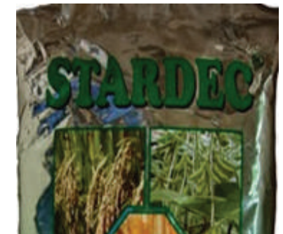
Contoh Mikrobial aktif

Koloni mikroorganisma (mikrob) aktif ini dapat hidup dalam pelbagai media dan berkembang tanpa dipengaruhi keadaan cuaca dan iklim, pertumbuhannya mudah dikawal dan bersifat genetik yang mudah dimodifikasi. Reaksi biokimianya dapat dikawal oleh enzim organisma itu sendiri. Penggunaannya memerlukan penyelenggaraan secara berterusan.