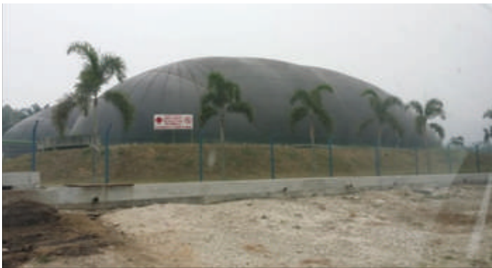
Kolam (Lagun) Biogas

dalam tangki pencernaan ( digester ). Sistem ini merupakan suatu kaedah mitigasi yang penting di dalam menangani pelepasan ( emissions ) gas rumah hijau ( green house gases ) yang berpotensi bagi kejadian pemanasan global (peningkatan suhu dunia). Komponen utama terhasil di dalam biogas adalah gas metana ( \text{CH}_4 , 60 - 70%) dan karbon dioksida ( \text{CO}_2 , 30 - 40%). Pelepasan gas metana dapat dikawal dengan menjadikan ianya sumber tenaga yang boleh diperbaharui ( renewable source of energy ) seperti bahanapi dan penjanaan tenaga elektrik.