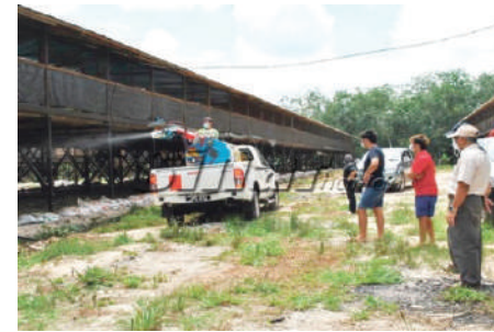
Semburan Racun Serangga