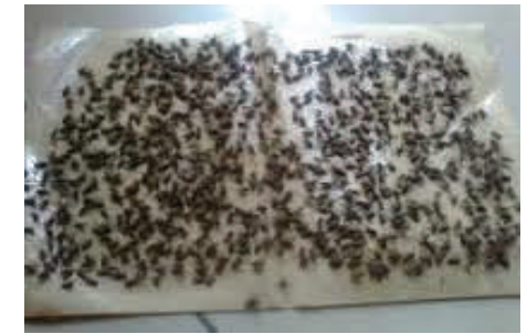
Alat Perangkap Lalat