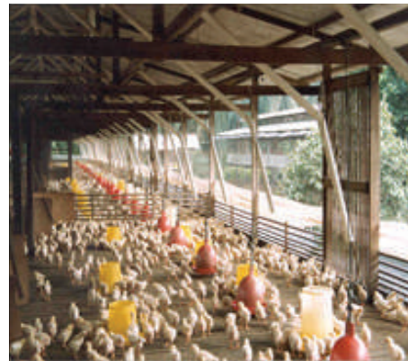
(b) Lantai tinggi (reban terbuka)