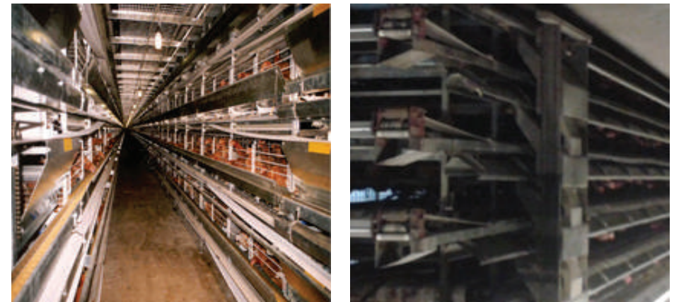
Reban menggunakan sistem sangkar berpelapik ( 'belt cage' )

Dalam reban yang menggunakan sistem sangkar berpelapik ( belt cage ) yang lazim digunakan bagi ayam penelur didapati tinja terjatuh ke pelapik bawah sangkar. Melalui kaedah ini, tinja yang dikeluarkan dari reban mempunyai kandungan kelembapan antara 30-60%. Tinja yang berkelembapan kurang dari 30% adalah lebih mudah diangkut dan kurang kandungan gas ammonia. Sistem sangkar berlapik dapat mengurangkan tenaga pekerja namun melibatkan kos 50% lebih mahal berbanding sistem lantai tinggi.