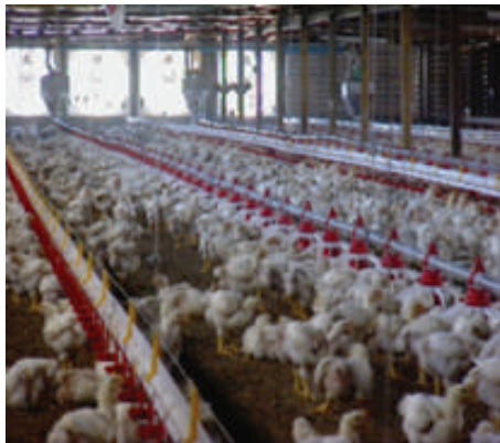
(a) Lantai sarap (reban tertutup)

Sekiranya air minuman dari reban tertumpah ke bawah, ini boleh menyebabkan sisa menjadi lembap dan menghasilkan pencemaran bau yang boleh menarik perhatian lalat.