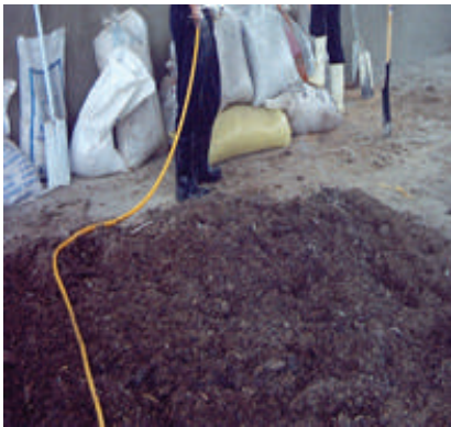
Menyiram air - tambah kelembapan ( \pm 60\% )