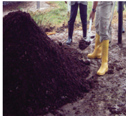
Membalikkan kompos (secara manual / mesin)