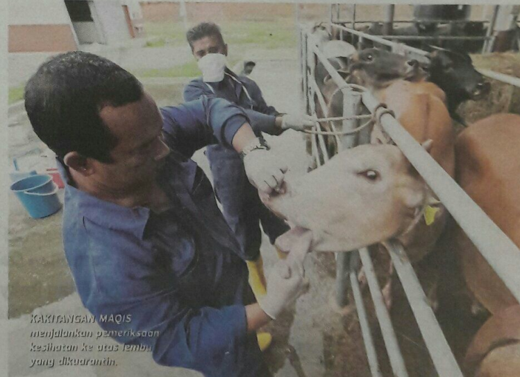
KAKIRANGAN MAQIS menjalankan pemeriksaan kesihatan ke atas lembu yang dikuarantin.