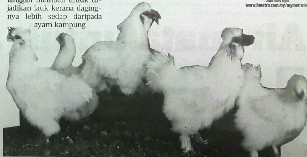
EFFIE membeli baka ayam sutera bermula daripada tiga ekor hingga menjadi 400 ekor.

Menurutnya, ayam sutera ini bukan saja dijual untuk dipelihara, malah ramai pelanggan membeli untuk dijadikan lauk kerana dagingnya lebih sedap daripada ayam kampung.