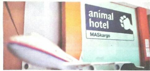
ANIMAL Hotel di KLIA.

Sepang: Animal Hotel mengendalikan sekurang-kurangnya 500 konsaimen ataupun penghantaran membabitkan binatang ruminan dalam tempoh sebulan. Pengurus Besar Operasi Kargo Masargo Jamaludin Ismail berkata, pihaknya menyediakan perkhidmatan berkenaan setiap hari. "Kita kerja 24 jam sehari dan tujuh hari seminggu bagi memenuhi kehendak dan permintaan pelanggan," katanya kepada Metro Ahad, di perkarangan Animal Hotel di Lapangan Terbang Antarabangsa Kuala Lumpur (KLIA), di sini. Diminta menerangkan proses yang dilakukan pihaknya membabitkan binatang ternakan yang baru tiba di KLIA dengan menaiki pesawat Airbus 330-200 dari Australia itu, Jamaludin berkata, pihaknya akan mengeluarkan binatang berkenaan daripada pe-