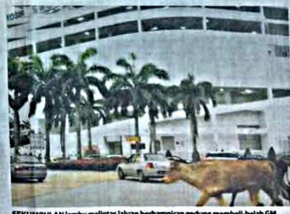
SEKUMPULAN lembu melintas lautan berhampiran gedung membeli-belah GM Klang, Bandar Botanic, Klang, Selangor.