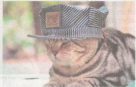
Jep dipakaikan topi oleh pemiliknya untuk sesi bergambar.