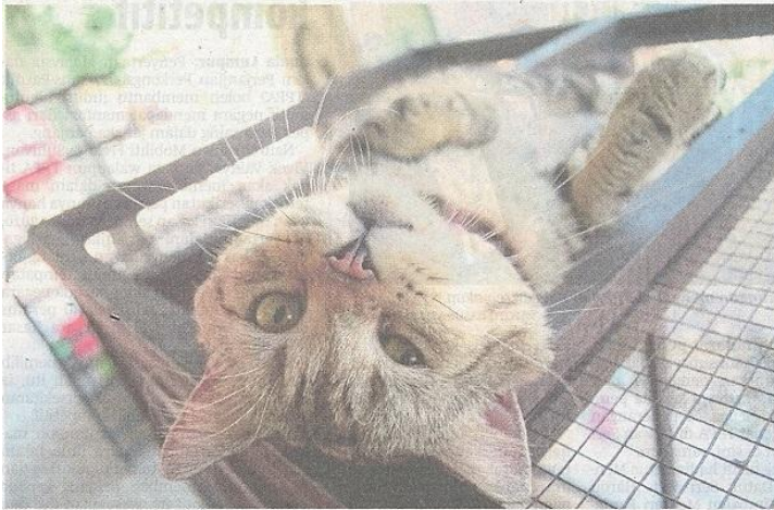
Antara aksi manja Jep di laman sosial.