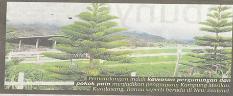
Pemandangan indah kawasan pergunungan dan pokok paku menjadikan pengunjung Kampung Mesilau, Kundasang, Ranau seperti berada di New Zealand.

Selain singgah rehat, makan dan membeli beraneka kraf tangan tempatan, pengunjung boleh menyaksikan panorama perkampungan masyarakat Kadazandusun di kawasan kaki bukit atau lembah gunung. Banyak sebenarnya tempat menarik lain sepanjang laluan, tapi kami tidak sempat singgah, antaranya Rumah Terbalik di Tulibong, Tamparuli dan Taman Negara Kinabalu, Ranau yang meliputi kawasan Gunung Kinabalu. Sebelum balik ke Kota Kinabalu, kami sempat santai di Jambatan Gayang, merentangi Sungai Mengkabong. Jambatan ini menghubungkan Tuaran dan Kota Kinabalu untuk melihat perkampungan atas air masyarakat rakat Bajau, selain penternakan ikan dalam sangkar. Jika bernasib baik, pengunjung boleh menyaksikan panorama Gunung Kinabalu berlatarkan bot yang seolah-olah menuju ke kawasan gunung. Kebanggaan rakyat Negeri di Bawah Bayu itu.