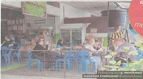
Pelansong asing menikmati masakan tradisional Kadazan Dusun di Pekan Nabal, Kota Belud.

» Panorama di Kundasang tenang dan mengagumkan