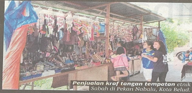
Penjualan kraf tangan tempatan di klinik Sabah di Pekan Nabalu, Kota Belud.