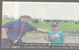
Penulis (kiri) berada di kawasan padang ragut di Kampung Mesilau, Kundasang, Ranau.

Ketika kami memintanya supaya meneruskan perjalanannya, remaja itu dengan sopan meminta maaf kerana mengganggu kami. Itulah sebenarnya budi bahasa orang Sabah. Sopan santun dan menghormati tetamu. Wajib singgah ke pekan Nabalu Sebelum sampai ke Kundasang, tidak lengkap kalau tidak singgah di Pekan Nabalu, Kota Belud.