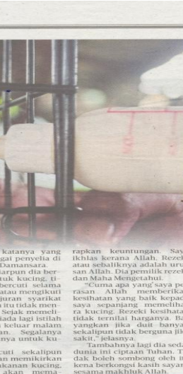
KUCING kesayangan dibelai umpama anak sendiri.

Malah jika ada yang berkata rezekinya murah kerana memelihara kucing, dia tidak pernah memikir-kirkannya kerana beranggapan rezeki hanya Allah yang tahu.