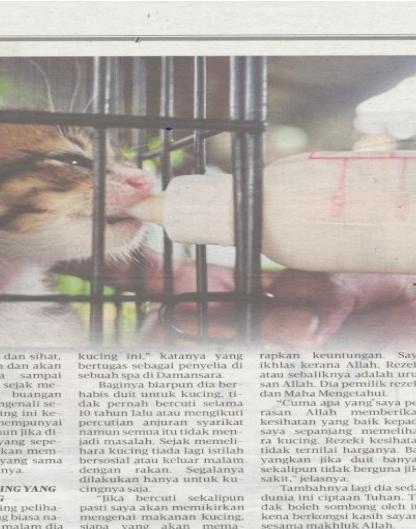
KUCING kesayangan dibelai umpama anak sendiri.

Tambahnya lagi dia sedar dunia ini ciptaan Tuhan. Tidak boleh sombong oleh itu kena berkongsi kasih sayang sesama makhluk Allah.