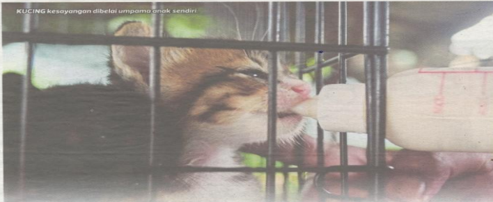
KUCING kesayangan dibelai umpama anak sendiri.

atu yang menjantik hari saya untuk mengingati Tuhan. Masih ada yang menyayang saya rupanya. Sejak itu saya tokek terasak hidup dengan memelihara kucing," katanya memulakan cerita.