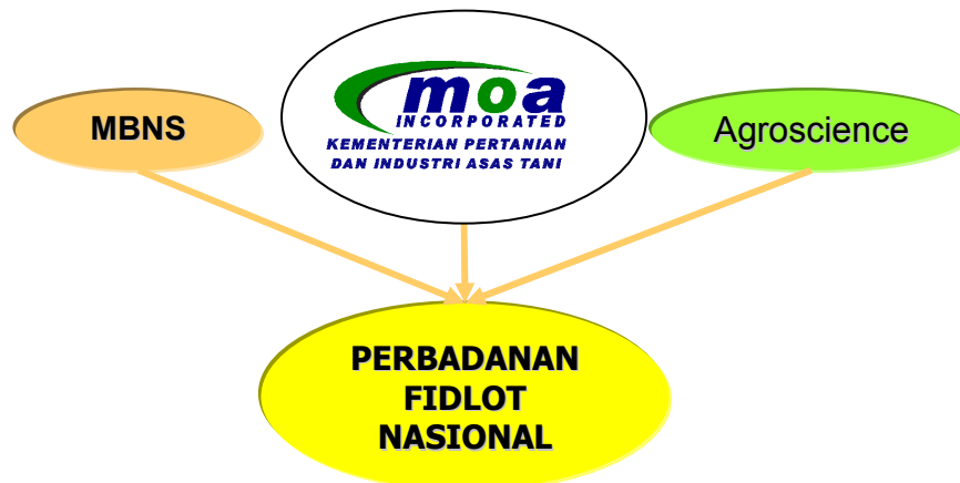
Rajah 2: Pembentukan Perbadanan Fidlot Nasinal

Perbadanan Fidlot Nasional ditubuhkan dengan gabungan Agrosience Industries Sdn Bhd sebagai peneraju utama dengan Kementerian Pertanian dan Industri Asas Tani serta Menteri Besar Negeri Sembilan Pemerbadanan (MBNS Inc.) sebagai rakan ( counterpart ) yang memegang golden share bagi tujuan untuk memastikan perjalanan projek selari dengan agenda pembangunan industri pedaging negara.